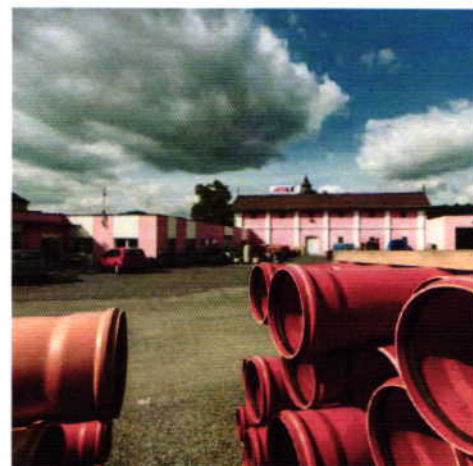
Provoz nám. 5 května

Obchodní činnost s průmyslovými armaturami nabízí v současné době široký sortiment prvků pro vytápění, vodu a plyn pro firmy i soukromníky. Součástí obchodní činnosti společnosti je především prodej zboží včetně dopravy, ale také kalibrace měřících přístrojů, seřizování a oprava armatur, kompletace zakázek pro stavební firmy, projekční a poradenská činnost. Počínaje rokem 2013 také zajišťuje dodávky a montáže ekologických topných systémů, tepelných čerpadel včetně úprav systému vytápění a přípravy TUV v objektech.